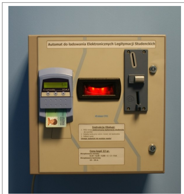
Automat doładujący karty CARTADIS CR3