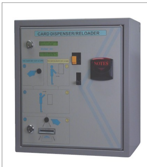
Cartadis DRC4 – sprzedaż i ładowanie kart magnetycznych