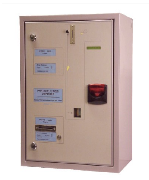
Cartadis CD20 – sprzedaż kart jednorazowych

Zakup karty odbywa się w automacie sprzedającym karty – Cartadis CD20.