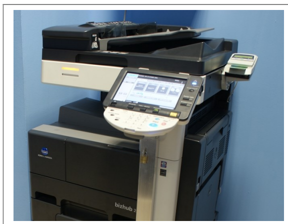
Widok z góry