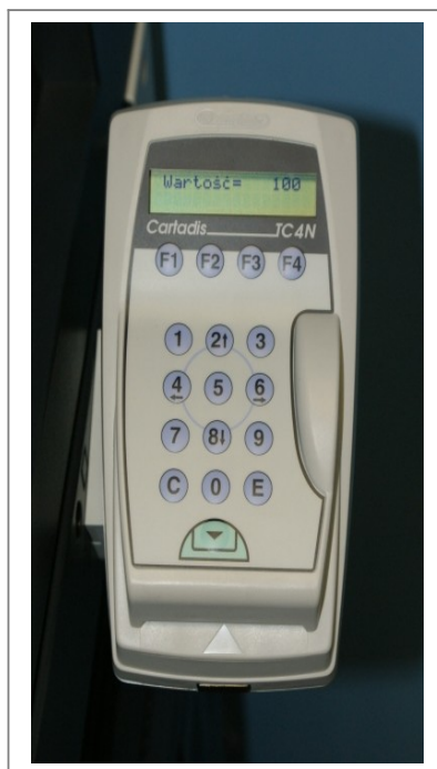
Cartadis TC4N z kartą w środku