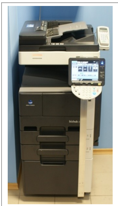
SSCK gotowy do pracy

Gdy użytkownik zakończy pracę i wysunie kartę lub środki zostaną wyczerpane, urządzenie zostaje automatycznie zablokowane – użytkownik musi doładować kartę (lub zakupić nową).